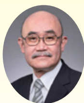
岡 隆 (日本大学教授)

私たち人間は、他者とのかかわりのなかで日常生活を営み、他者に対してさまざまな思いをいただき、他者に対してさまざまな働きかけをしています。それと同時に、他者もまた、私たちに対してさまざまな思いをいただき、私たちに対してさまざまな働きかけをしています。