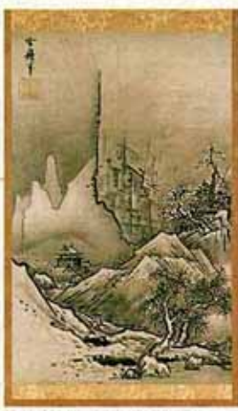
●雪舟 秋冬山水図(東京国立博物館蔵)

雪舟秋冬山水図(東京国立博物館蔵)／安楽寺八角三重塔(NHK資料写真)／瑞瑞光寺五重塔(同)／慈照寺銀閣(横山健蔵撮影)／西芳寺庭園(同)／龍安寺方丈庭園(同)／能面(面影孫次郎) (三井文庫蔵)／雪舟天橋立図(京都国立博物館蔵)／雪村松雲図(東京国立博物館蔵)／狩野元信花鳥図(便利堂撮影)／土佐光信清水寺縁起絵巻(東京国立博物館蔵)／鴛鴦對文辻が花染小袖(同)／他