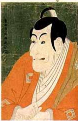
●東洲斎写楽 市川鯉藏の竹村定之進(東京国立博物館蔵)

善光寺本堂(NHK資料写真)／東大寺金堂(大仏殿)(飛鳥岡撮影)／池大雅横開山水図(東京国立博物館蔵)／与謝蕪村夜色楼台図(武蔵野太蔵・NHK資料写真)／田能村竹田亦復一楽帖牡丹図(奈良美術館蔵)／円山応挙雪松図(三井文庫蔵)／伊藤若冲動植絵群鶏図(宮内庁御物・便利堂撮影)／渡辺崋山鷹見泉石像(東京国立博物館蔵)／喜多川歌麿婦人相学十軒浮気之相(同)／東洲斎写楽市川鯉藏の竹村定之進(同)／葛飾北斎富嶽三十六景瀧風快晴(同)／他