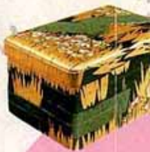
●尾形光琳 八橋楼絵巻(東京国立)